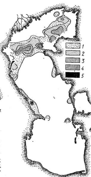
Рис. 4. Распределение биомассы синдесмии в Северном и Среднем Каспии в августе 1971 г. (в г/м 2 ): 1 — меньше 10; 2 — 10—50; 3 — 50—100; 4 — 100—500; 5 — больше 500.

среднем в 3 раза. Положение значительно выправилось к 1962 г. после успешной акклиматизации вселенцев из Азово-Черноморского бассейна — нереиса и синдесмии, которые расселились по всему морю (рис. 3, 4), почти вдвое увеличили биомассу кормового бентоса и заняли ведущее место в рационе севрюги и осетра (Тарвердиева, 1965).