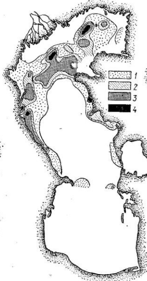
Рис. 3. Распределение биомассы нереис в Северном и Среднем Каспии в августе 1971 г. (в г/м 2 ): 1 — меньше 5; 2 — 5—10; 3 — 10—25; 4 — больше 25.